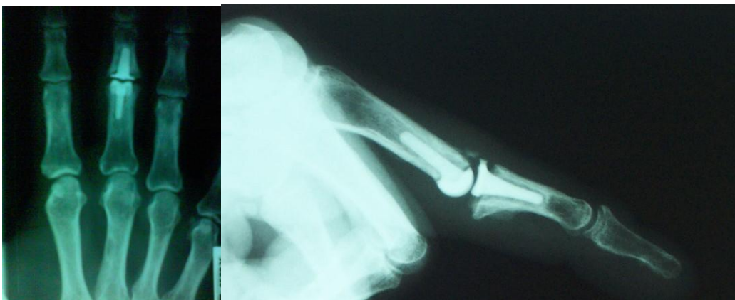
Aspetto radiografico: impianto di protesi PIP.