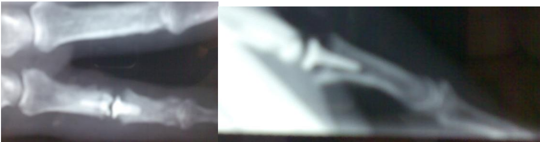
Quadro radiografico a 30 giorni. La linea di radiotrasparenza è dovuta al pirocarbonio radiotrasparente.