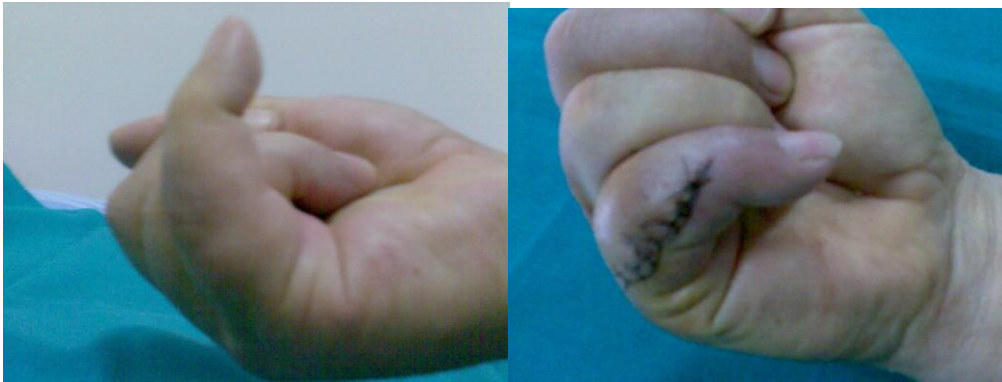
Aspetto clinico preoperatorio ed a 5 giorni dall'intervento.