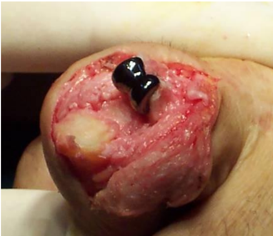
Aspetto intra-operatorio della componente protesica impiantata nella falangetta prossimale.