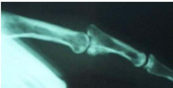
Caso 2: frattura base P2 del dito medio.